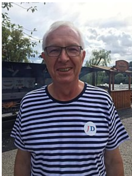
Jiří Drahoš při prezidentské kampani v srpnu 2017.