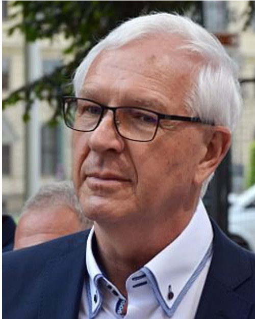
Prof. Jiří Drahoš (2017)

prof. Ing. Jiří Drahoš , DrSc. , dr. h. c.